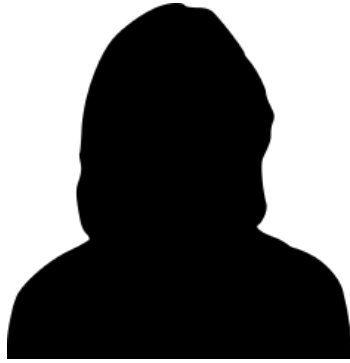
Melissa Postma Pflegehelferin, WB 2